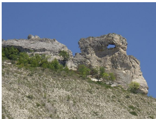
Защитена местност Пробития камък – Цар Борисовия лопен, земл.с.Равна, общ.Провадия

На територията на ТП ДГС ПРОВАДИЯ няма обявени с отделни заповеди вековни дървета които да са в ДГТ.