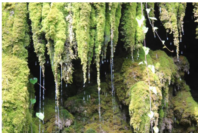
Неновски водопад, земл. с.Неново, общ.Провадия