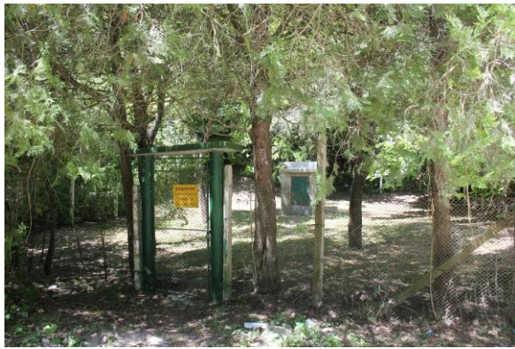
Каптаж отдел 105, подотдел «ж», земл.гр.Провадия