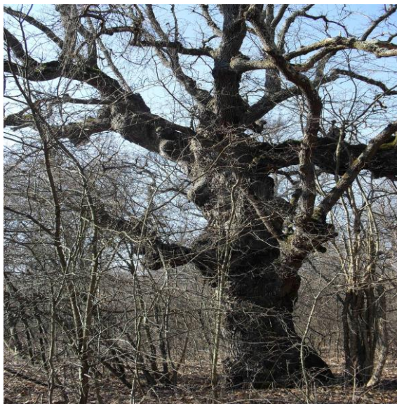
Дърво на възраст над 100 години – ЗМ Снежанска кория, земл.с.Снежина