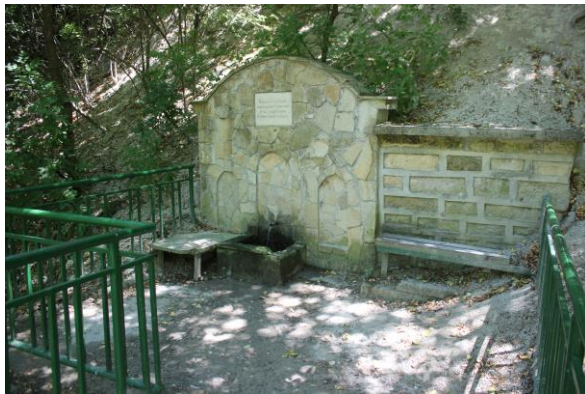
Чешма отдел 105, подотдел «б», земл.гр.Провадия