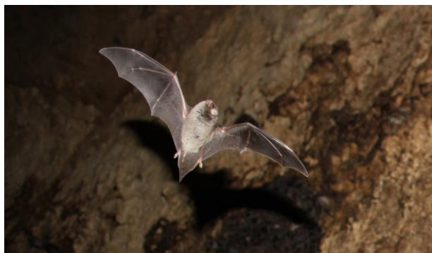
Прилепче, индивид от колонията, установена в Неновския боаз

Скално-каменно водохранилище в отдал 49, местност Неновски боаз е обитавано от колония прилепи, видът не е установен, колонията е над 20бр.