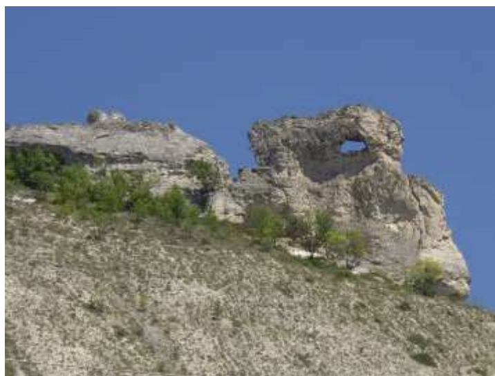
ЗМ Пробития камък – Цар Борисовия лопен, земл.с.Равна, общ.Провадия

Съгласно последните действия по изграждането на Национална екологична мрежа „Натура 2000” на територията на страната, към ВКС1.1, т.4 идентифицираните защитени зони по смисъла на Закона за биологичното разнообразие са: