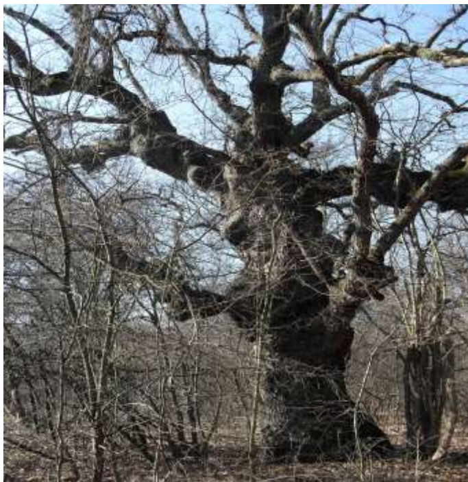
Дърво на възраст над 100 години ЗМ Снежанска кория, земл.с. Снежина

2. При теренната работа да се извършва наблюдение на показатели като жизненост на отделните дървета, структура на насаждението, здравословно състояние, наличие на дегенеративни