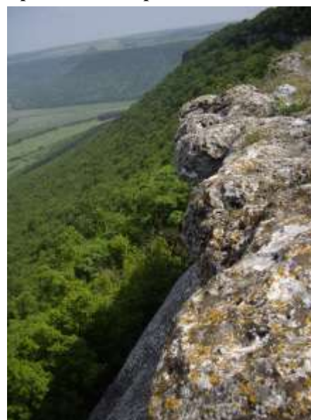
с.Невша, общ.Венрино

Обхваща следните подотдели, Държавната горска територия: 1 - с, 2, 3, 5; 26 - б, 1, 2, 3; 28 - а, г, з, и, п, р, с, 3, 6; 31 - 2, 4, 10; 32 - в, 2; 38 - 3; 39 - г, д, з, 8, 10, 11, 14, 15; 42 - 5; 44 - д, 4, 5, 12; 48 - и, л; 49 - а; 52 - а, б; 58 - о; 60 - 1; 61 - ж; 62 - а, д, л, м, 1, 2, 3, 4, 5, 6; 63 - г, ж, к, 1, 2, 3, 4, 10, 11; 67 - г, ж, 2, 6; 68 - а, д; 69 - к, 3; 70 - г, 2, 3; 73 - е; 74 - г, д, ж, з, 1, 2, 3; 75 - а, б, в, 2, 3, 4, 5, 6, 7; 76 - б, 1; 86 - д, ж, з, и, м; 101 - ж, з, и; 105 - г, з; 107 - в, д, 2, 8; 110 - а, б, в, д, 1, 2, 3; 111 - а, г, 1, 2, 5, 6, 7, 8, 9, 10; 113 - б; 114 - 2; 115 - д, 10; 119 - н; 132 - д; 169 - а, б, в, д; 170 - з; 171 - е; 172 - д; 173 - в; 174 - д, е; 186 - а, ж, к, м, 3, 4, 5, 6, 7; 221 - а, б, в, г, д, е, ж, з, и, к, л, 1, 2, 3, 4, 5, 6, 7, 8; 222 - г, ж, с обща площ 831,7ха