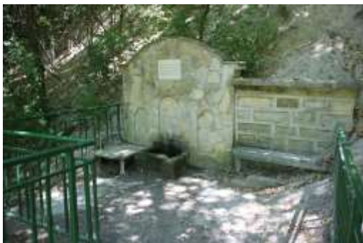
Чешма отдел 105, подотдел - 8, земл.гр.Провадия

използвани за лечебни, профилактични, питейни и хигиенни нужди и утвърдени със заповеди на МОСВ.