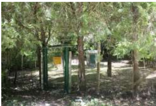
Каптаж отдел 105, подотдел - и, земл.гр.Провадия

Съгласно Закона за водите, чл.119, ал.1, т.1, подземните водни тела са определени като зона за защита на питейните води. Съгласно чл.119, ал.3, по отношение на зоните, в които водите са чувствителни към биогенни елементи, територията на стопанството е причислена към чувствителна зона и уязвима зона.