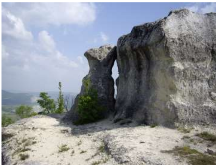
ЗМ Голямо и малко було, земл. с.Невша, общ.Ветрино

2.Препоръчително е да се използват мониторинговите схеми и формуляри на Националната система за мониторинг на биологичното разнообразие за отразяване на основните индикатори касаещи ВКС 1.1.