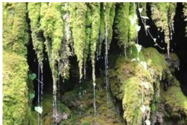
Неновски водопад, земл. с.Неново, общ.Провадия

4.Препоръчително е мониторингът да включва и документална проверка и снимков материал.